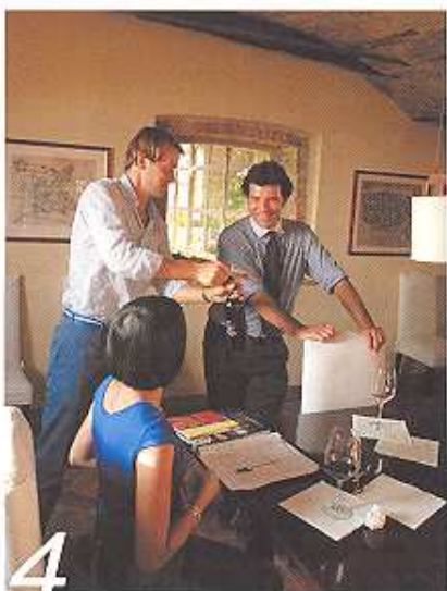
3/意大利共和国第一任总统Luigi Einaudi阁下 4/在艾劳迪庄园的红酒品鉴室

“当我们随着 Matteo 先生踏进那个古老而干净的酒窖时，才得知一个令我们吃惊的消息。原来，这个庄园的第一任主人，也就是 Matteo 的外公，是意大利共和国的第一任总统 Luigi Einaudi 阁下，也是意大利著名的经济学家。我们一下子安静了下来，听 Matteo 先生娓娓道出酒庄的历史。”