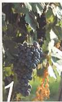
1/正在生长中的葡萄。 2/皮埃蒙特是意大利最有名的美酒产区之一，除了酒好，景象也很美。