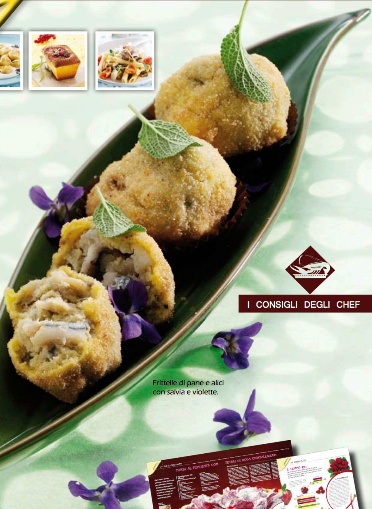
Frittelle di pane e alici con salvia e violette.